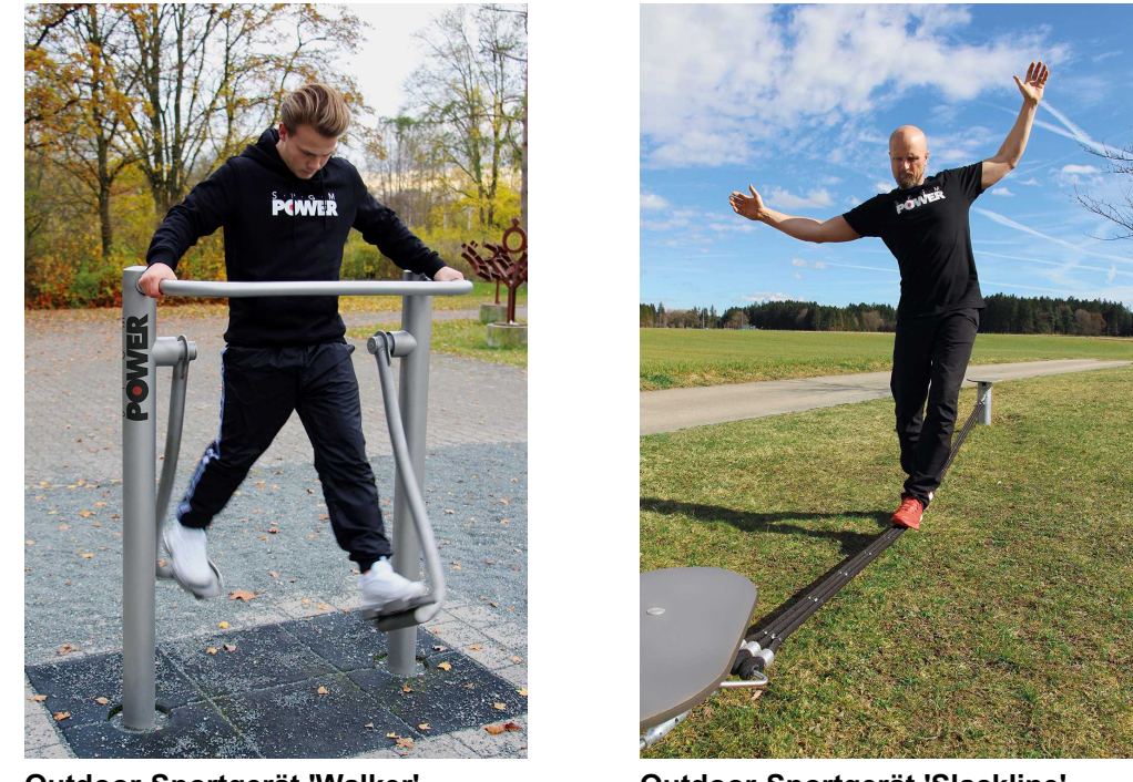
Outdoor-Sportgerät 'Walker' Outdoor-Sportgerät 'StacKline'